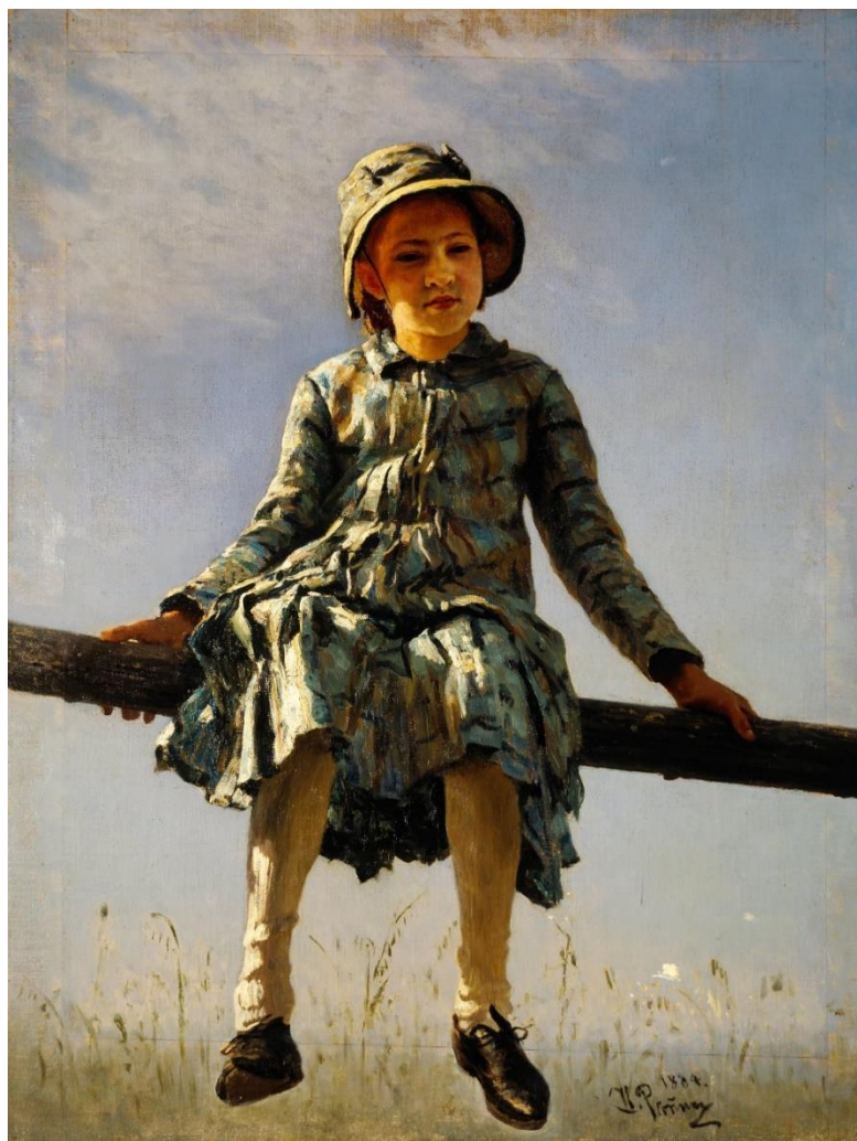
Илья Репин. Стрекоза. 1884

Государственная Третьяковская галерея, Москва.