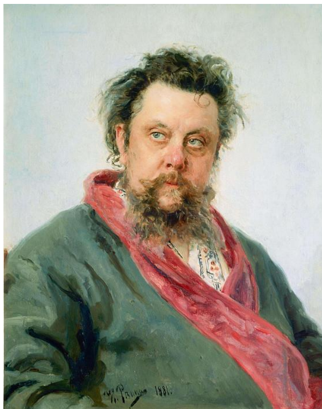
Илья Репин. Портрет композитора М. П. Мусоргского. 1881