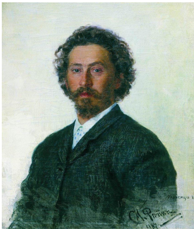
Илья Репин. Автопортрет.1887

Необычная чёткость рисунка, тёплый колорит, яркость и гармоничность красок являются особенностями произведений Ильи Репина.