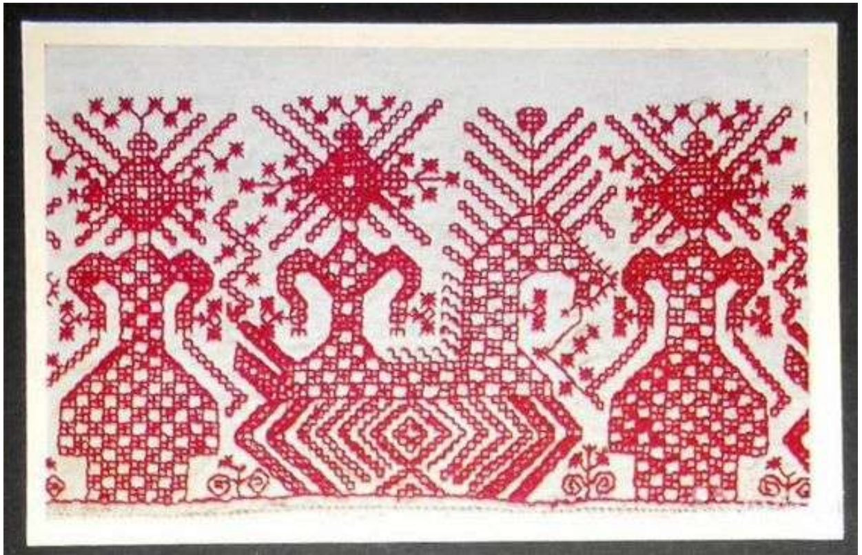
Часть подола женской рубахи. Архангельская губ., I половина XIX в. Холст, красные бумажные нити.