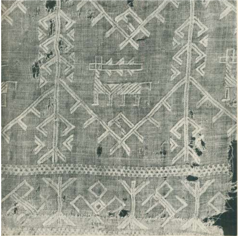
Фрагмент столешника. Конец XV - начало XVI в. Север. Вышивка двусторонним косым швом белыми льняными нитями по белому льняному полотну. 26x55. Снят в 1957 году с иконы «Троица ветхозаветная». Белозерск