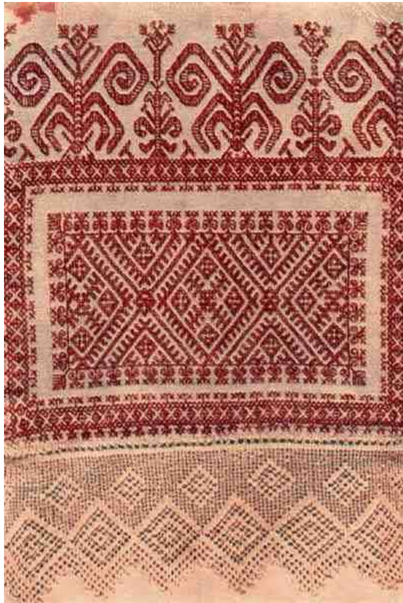
Головное полотенце. Вторая половина XIX в. д. Ивановская на р. Топсе Шенкурского у. Архангельской губ. Вышивка двусторонним швом красными хлопчатобумажными нитями по льняному полотну 34x240. Пост. В 1966 г. Из экспедиции в Архангельскую обл. (Н. В. Тарановская, О. А. Почтенный).