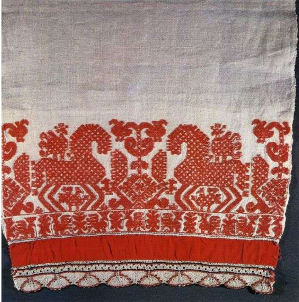
Покрывало на свадебную повозку (фрагмент) Вышивка хлопчатобумажной нитью двусторонним швом