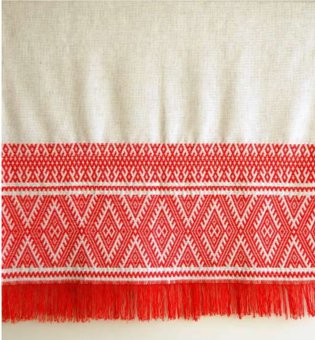
б) композиционное решение изделий прямоугольной формы (столешник, скатерть) (работы учащихся ДХШ №1 г. Черногорск)