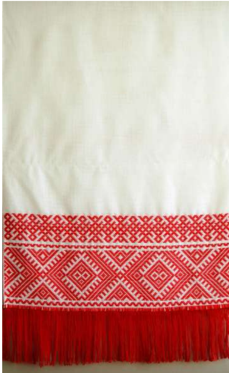
б) композиционное решение изделий прямоугольной формы (столешник, скатерть) (работы учащихся ДХШ №1 г. Черногорска)