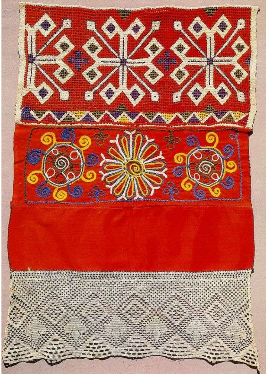
Мотивы круга-розетки и лунницы в вышивке полотенец.