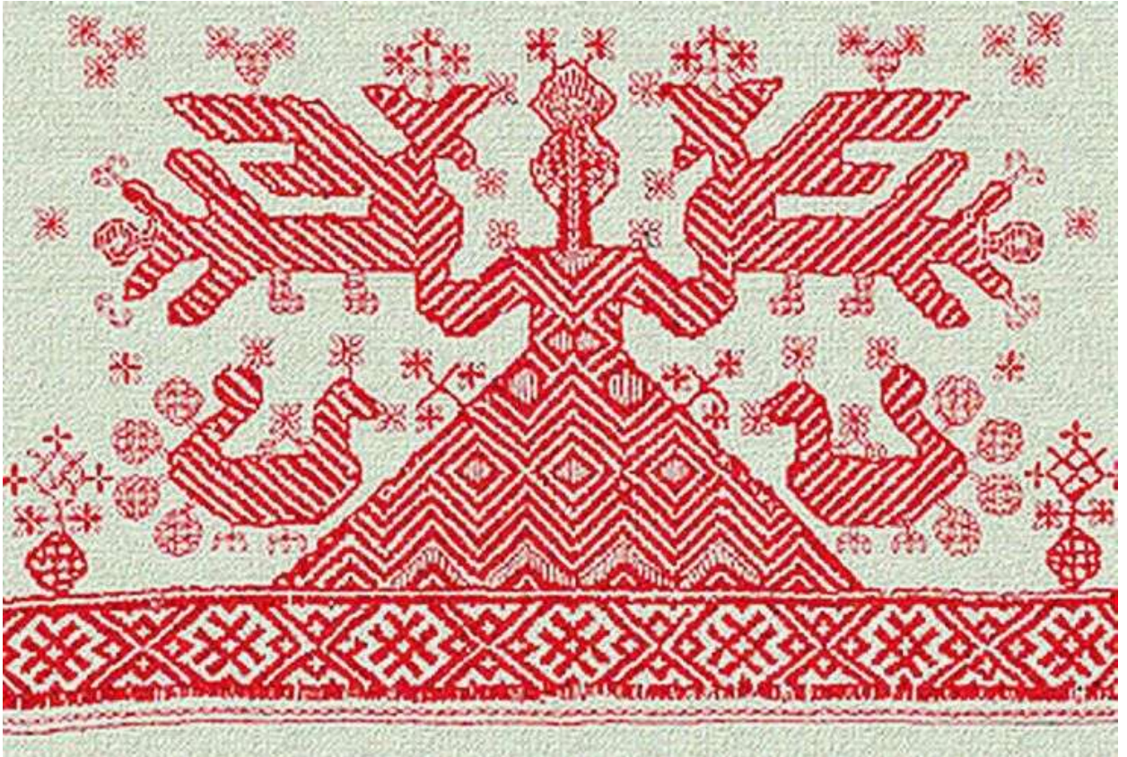
Мотив восьмиконечной звезды.