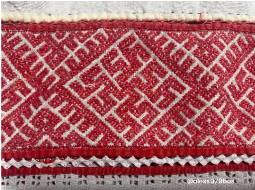
Полотенце из Вельского у. Вологодской губ. Холст, хлопчатобумажные нити; Техника строчка и набор. Вельский музей.