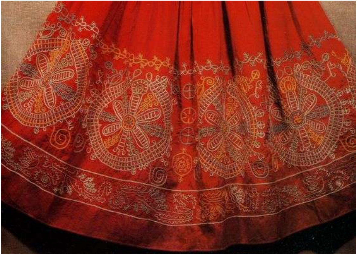
Узоры месяцы или круги. Каргопольский уезд