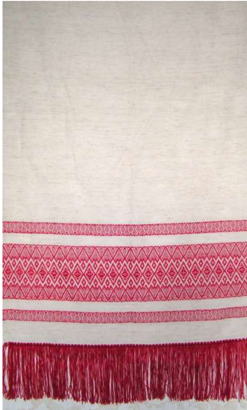
а) схема композиционное решение изделий прямоугольной формы (столешник, скатерть) (работы учащихся ДХШ №1 г. Черногорс